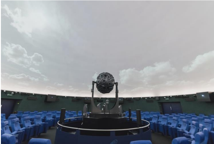
Das Model 9 des Zeiss Sternenprojektors im Zentrum des Kuppelsaals.